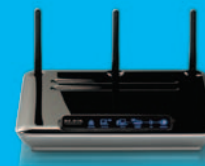
Modem-Routeur Sans Fil N1 (F5D8631fr4A)