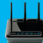
Routeur Sans Fil N1 (F5D8231fr4)