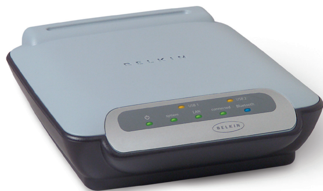
F8T030uk 100 Metre Range* (333 Feet)

En utilisant le protocole DHCP, votre Point d'Accès obtient automatiquement une adresse IP lorsque relié au réseau. La connexion de tous les périphériques Bluetooth est rendue sécuritaire grâce à un cryptage sur 128 bits, et une authentification de l'utilisateur.