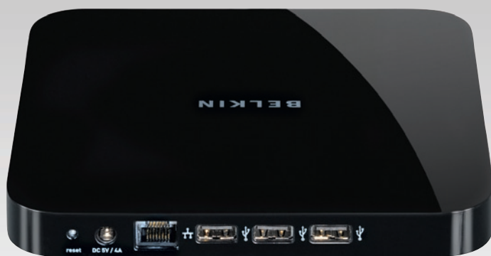
REINICIO ALIMENTACIÓN ETHERNET USB