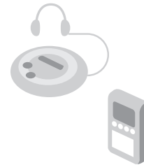
Portable CD player or MP3 player